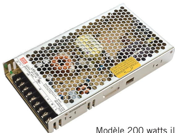
Modèle 200 watts illustré